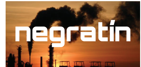
SOBRE ENTORNO FOTOGRÁFICO OSCURO